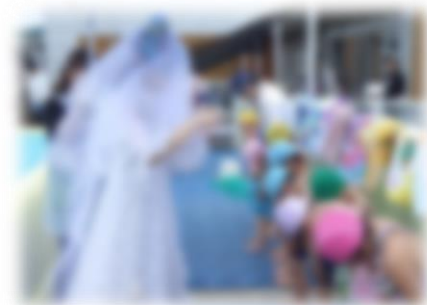
水の神様の安全祈願に みんな真剣!!