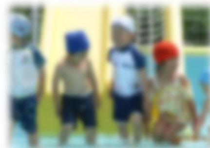
今年度初のプールで 「つめたーい♪」