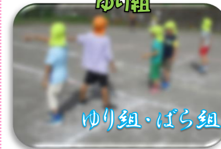
ゆり組・ばら組はスポーツの秋!