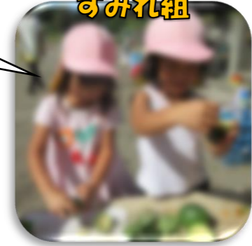
カラスウリでのお料理面白いね!