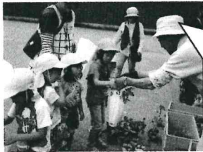
市日入苗を買いに