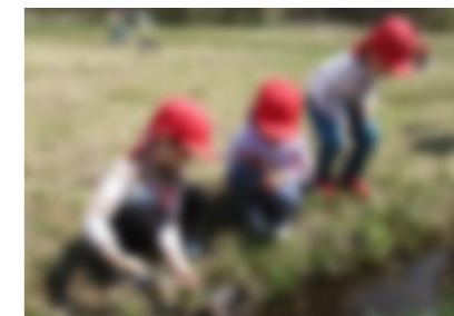
何かいないかなあ～