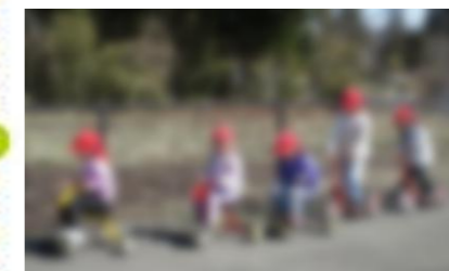
みんなでツーリング