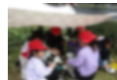
お料理美味しくできるかな?