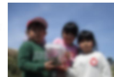
虫ゲット!! 後で調べよう!