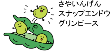
さやいんげん スナップエンドウ グリーンピース