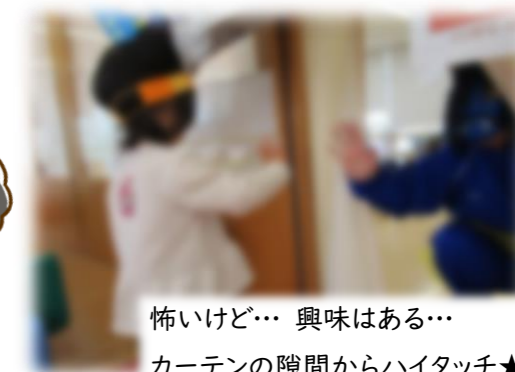
怖いけど... 興味はある... カーテンの隙間からハイタッチ★