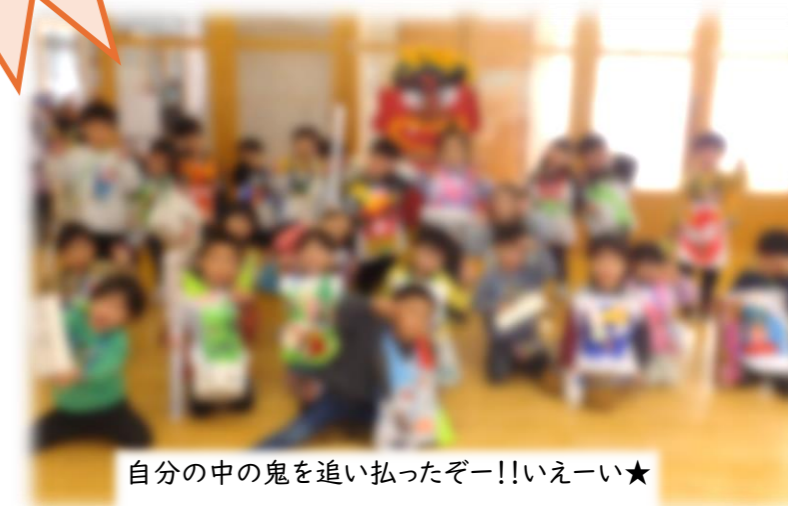
自分の中の鬼を追い払ったぞー!!いえーい★